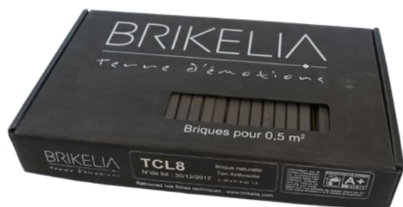
Boîte pour \pm 0,5 \text{ m}^2 CHROMA