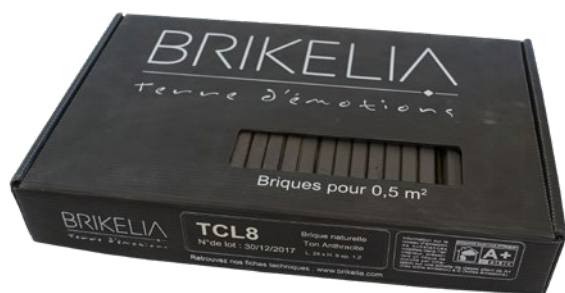
Boîte de 0.5 m 2 CHROMA